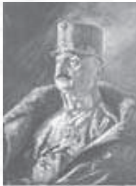
Brössler: Portret Friderika Širca, 1916, olje, 45x36 cm

Umrl je 15. decembra 1948 na zagrebški polikliniki. Pokopan je v Žalcu.