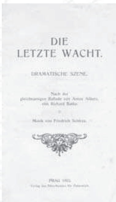
Naslovna stran knjižice z libretom Poslednje straže (v nemščini), tiskane v Pragi 1905